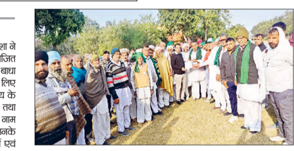
जीद। ज्ञान सौंपने आए किसान।