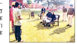
जीद। लोक अदालत में मौजूद सीजेएम मामलों की सुनवाई करते हुए।