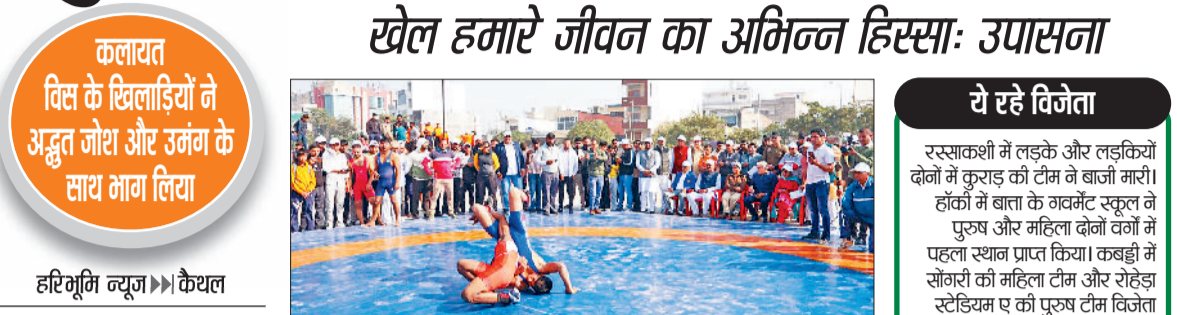
कैथल। कुराड़ी में दमखम दिखाते खिलाड़ी।