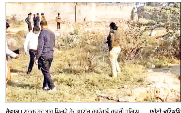
कैथल। युवक का शव मिलने के उपरान्त कारवाई करती पुलिस।