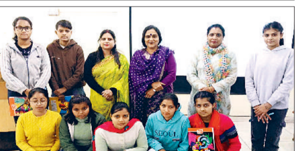
जीद। प्राचार्य के साथ मौजूद छात्राएं।

जुलाना। जुलाना क्षेत्र के गांव बराड़ खेड़ा स्थित बाबा तक्रिया मंदिर में वीरवार को वार्षिक कीर्तन और कीर्तन का मध्य आयोजन किया गया। सुबह पूजा, अर्चना के साथ कार्यक्रम की शुरुआत हुई। मंदिर परिसर में पहले हवन खास संपन्न कराया गया। जिसमें ग्रामीणों सहित श्रद्धालुओं ने आहुतियां डाल कर सुख व समृद्धि की कामना की। हवन के बाद बाबा तक्रिया मंदिर में श्रद्धालुओं के लिए मंडार का आयोजन किया गया। मंडार में आसपास के गांवों से आए हजारों मंत्रियों ने प्रसाद ग्रहण किया। ग्रामीणों ने बताया कि मंदिर में हर वर्ष धूमधाम से कीर्तन का आयोजन किया जाता है और भक्त पूरे वर्ष इस दिन का इंतजार करते हैं। मंदिर में रातभंग शिविर का भी आयोजन किया गया जिसमें 75 युवाओं ने रक्तदान किया। मंच पर पहुंचे मजदूर कलाकारों ने अपने भक्ति गीतों से माहौल को पूर्ण आध्यात्मिक बना दिया। दोलक, झंझर की ताल और मंजनों की आवाज से पूरे मंदिर परिसर गुंज उठा। कलाकारों के झंझर में आर श्रद्धालु भी भाव, विमोह होकर हस्तों नजर आए। ग्रामीणों ने बताया कि बाबा तक्रिया मंदिर गांव की आस्था का प्रमुख केंद्र है।