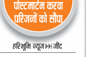
पुलिस ने शवों का पोस्टमार्टम करवा परिजनों को सौंपा