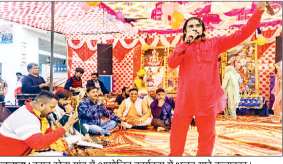
जुलाना। बराड़ खेड़ा गांव में आयोजित कार्यक्रम में भजन गाते कलाकार।