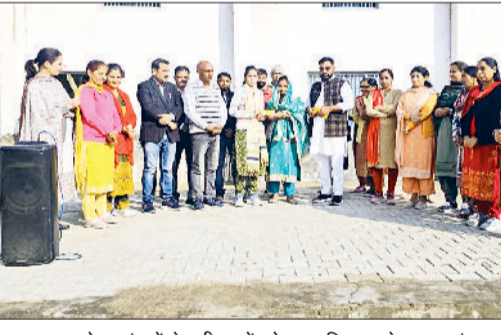
जुलाना। बुढ़ाखेड़ा गांव में मेधावी छात्रों को सम्मानित करते हुए सरपंच।